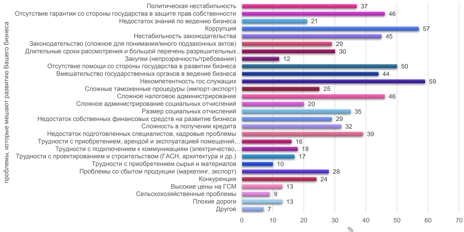
Рис. 3. Структура ответов «Что мешает развитию вашего бизнеса» на основе личного опыта предпринимателей.

Диаграмма демонстрирует факт проблем в развитии бизнеса у всех предпринимателей, принявших участие в опросе.